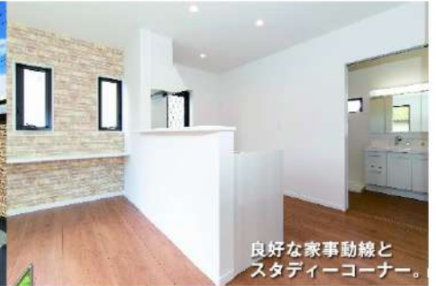
良好な家事動線とスタイリーコーナー。