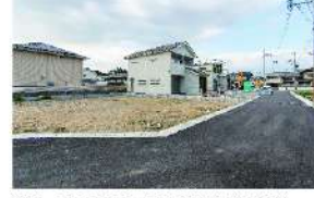
※グリーンタウン狐井 Part1現地で撮影。(令和2年4月)