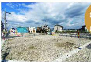
※グリーンタウン築山現地で撮影。(令和2年4月)

土地+建物セット参考価格 2,280万円～ (外構工事費・消費税込み) S7号地 ●敷地面積/143.10㎡ ●延床面積/97.20㎡ ※上記掲載の価格はニューモダン仕様の場合の価格です。