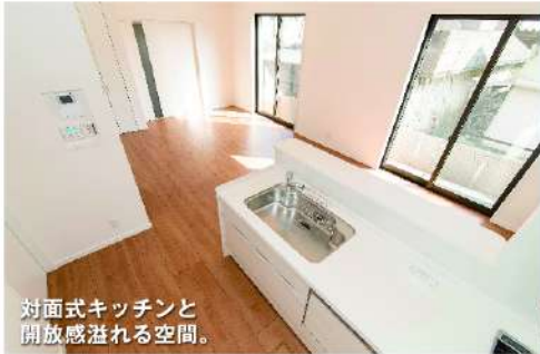
対面式キッチンと開放感溢れる空間。

この+P モデルハウス見学会 & 住宅ローン相談会開催 奈良エリア AM10時～PM5時