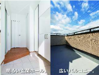
明るい玄関ホール。